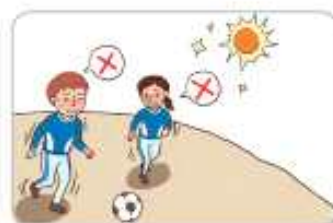
3 더운 시간대에 휴식을 취한다.(운동장 등 실외활동을 자제한다.)