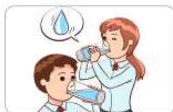
1 물을 자주 적당히 마신다.