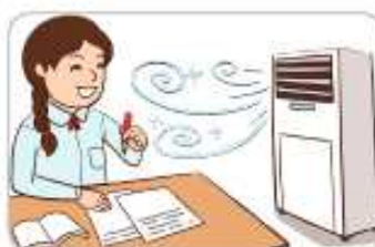
2 시원하게 지낸다.